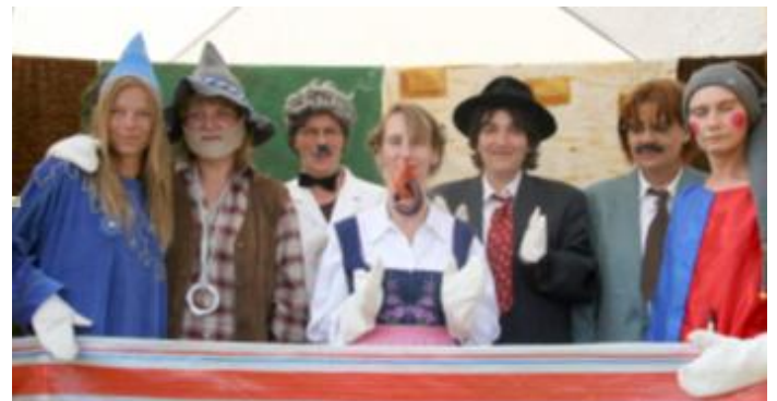
Viele Zuschauer verfolgten gespannt die „BUNTE BÜHNE“