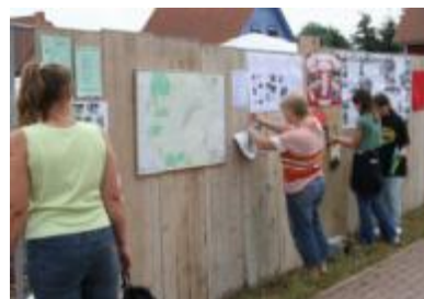
< Siedlerbund Ferienspaß >