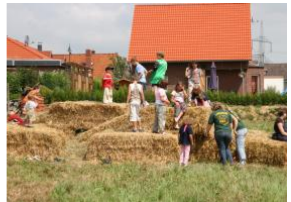
Strohburg der Landjugend