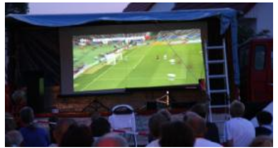
Um 21:00 Uhr dann das WM Spiel um Platz 3 zwischen Deutschland und Portugal Leinwand – Open Air Flair in Pohle.