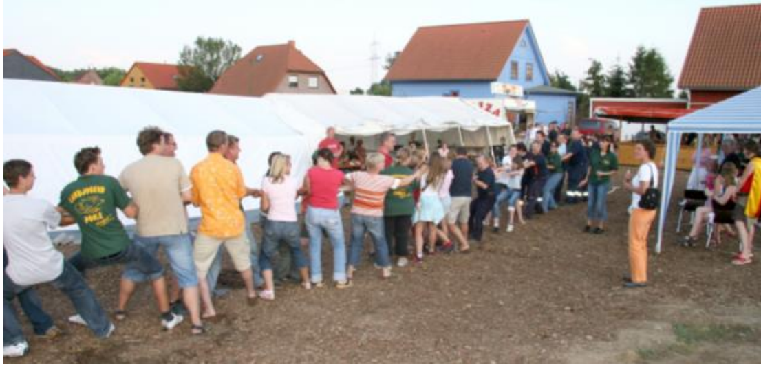
Tauziehen: Neubaugebietler mit Helfer gegen die Feuerwehr