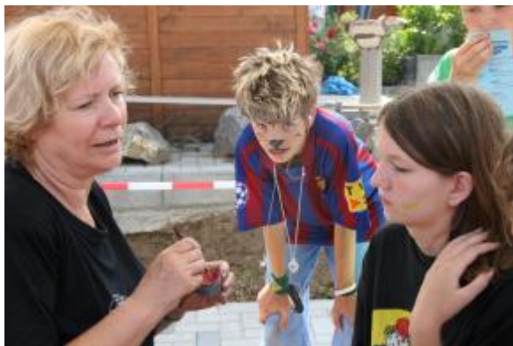
Kinderschminken vom Kindergarten Förderverein